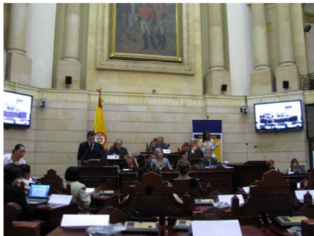
Cerimônia de abertura

Ele se referiu ao compromisso assumido pelos países em torno dos Objetivos de Desenvolvimento do Milênio lembrando que o terceiro objetivo (3) propõe especificamente promover a equidade de gênero e a autonomia da mulher e todos os objetivos estão relacionados com aspectos essenciais ao bem-