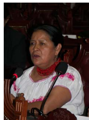
A deputada Otilia Lux, da Guatemala.

Foi enfatizada, nesse sentido, a necessidade de financiar programas de capacitação para mulheres que querem iniciar-se na política e, em particular, a importância de promover a participação tanto política como