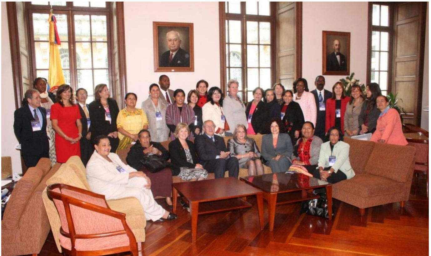
Participantes do congresso "Rumo a uma Agenda Legislativa para o Desenvolvimento com Perspectiva de Gênero nas Américas"