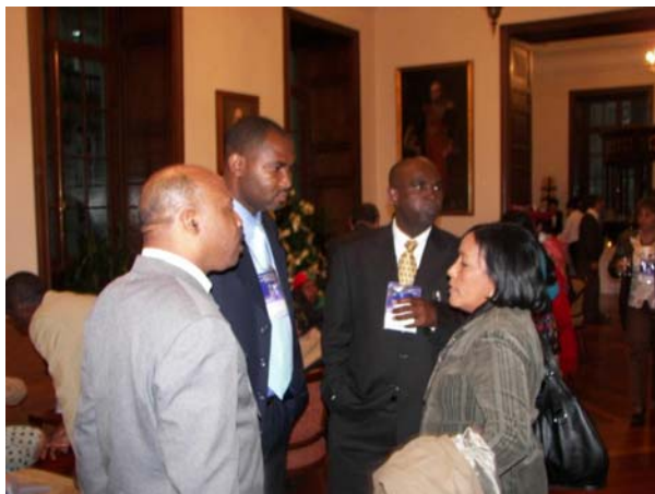
Deputados do Haiti e da República Dominicana conversando