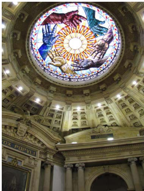
Cúpula do Senado colombiano.

O Congresso “Rumo a uma agenda legislativa para o desenvolvimento com perspectiva de gênero para as Américas” se realizou nos dias 20 e 21 de novembro de 2008 na sede do Senado da República da Colômbia, em Bogotá. Na oportunidade participaram 37 parlamentares vindos da Bolívia, Brasil, Canadá, Colômbia, Costa Rica, Cuba, Dominica, Haiti, Granada, Guatemala, Jamaica, México, Peru, República Dominicana e Santa Lucia. O congresso foi co-organizado pelo FIPA e a Fundação Agenda Colômbia.